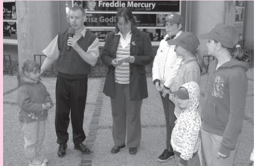
A rajzverseny eredményhirdetése