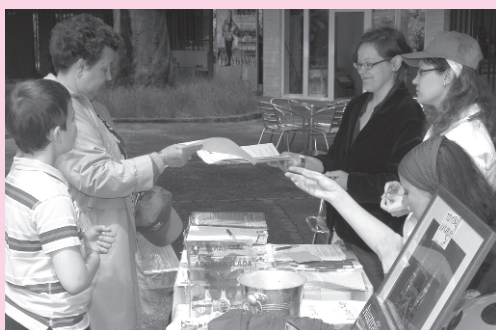
Ajándékok, emléklapok átadása