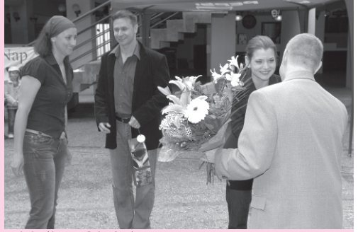
Virágátadás a művészeknek