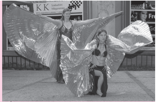
Az Ízisz Hastánc Stúdió fellépése