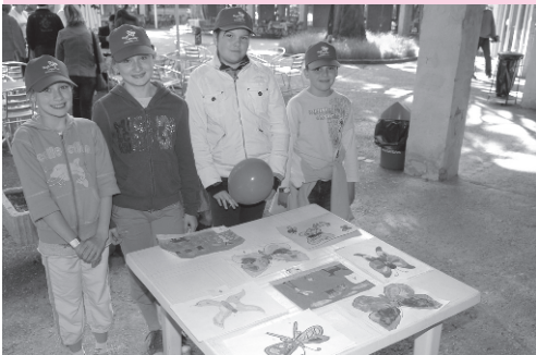
A rajzverseny nevezői