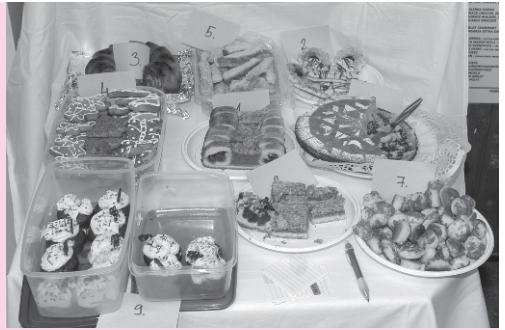
A sütiversenyre érkezett sütemények