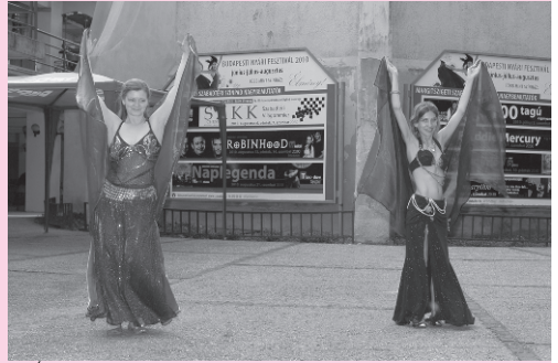
Az Ízisz Hastánc Stúdió fellépése