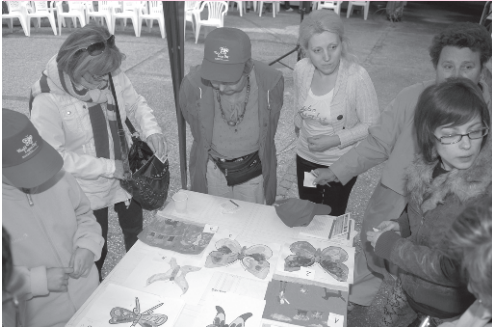
A rajzversenyre érkezett nevezések