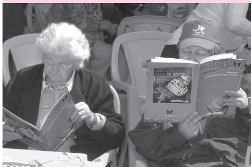
Mindenki megkapta legújabb Pillango magazinunkat, a Reuma Híradót, a Medical Tribune magazint, Lupus Day baseball sapkát.