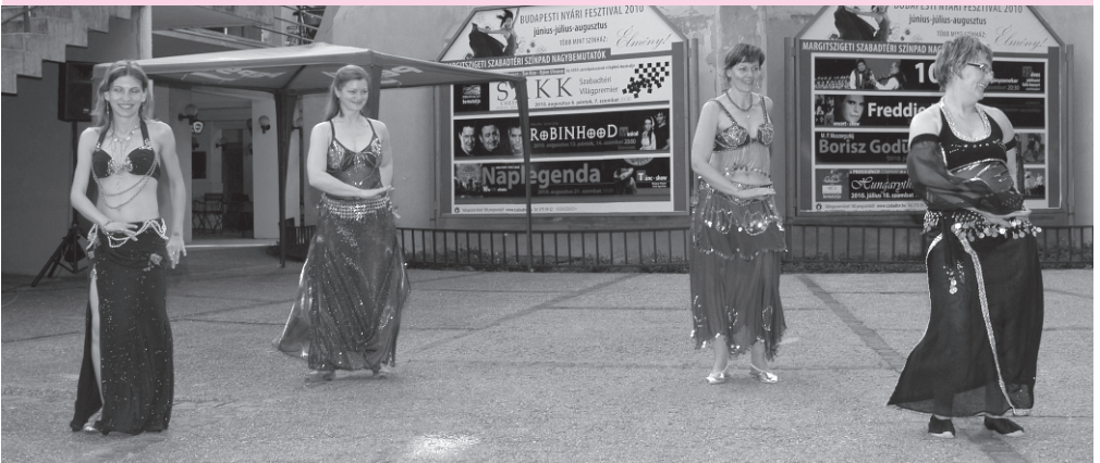
Az Ízisz Hastánc Stúdió fellépése