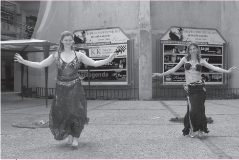
Az Ízisz Hastánc Stúdió fellépése