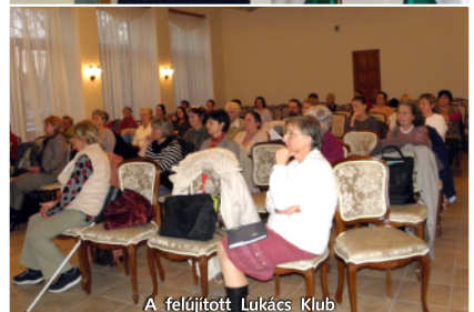
A felújított Lukács Klub