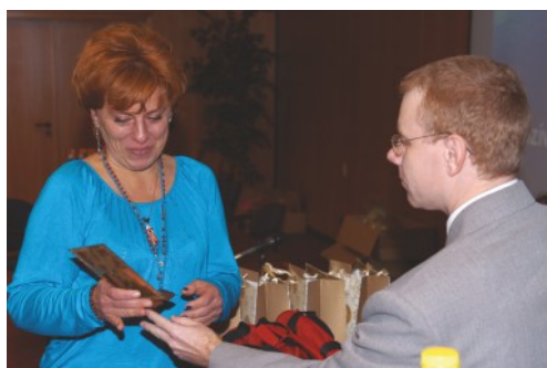
A II. Hevér Krisztina Díj Emlékplakett átadása